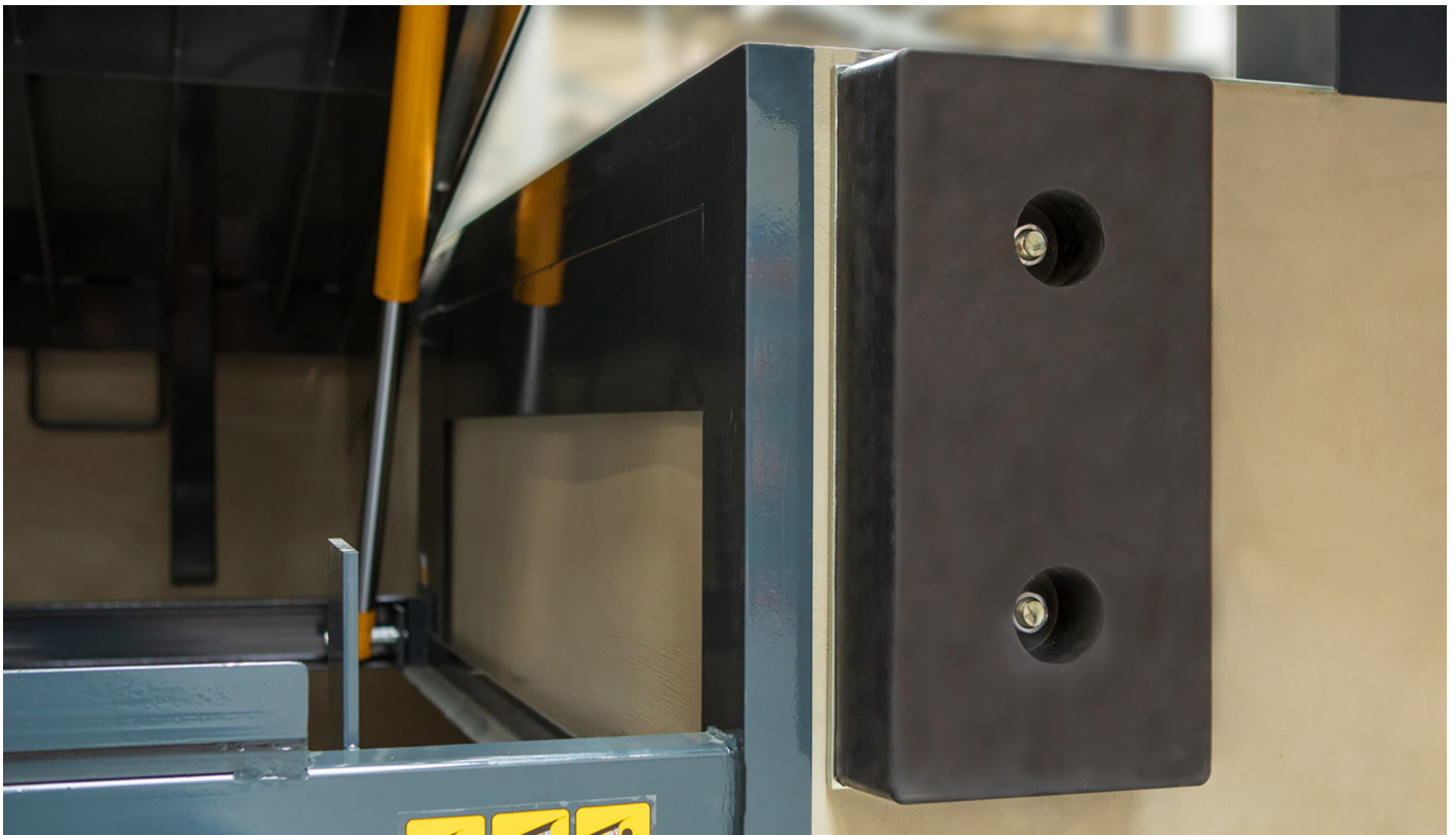
Parkovací gumové dorazy.